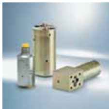
› Ojačevalniki tlaka Pressure intensifiers