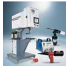
› Instalacijska oprema Installation technology