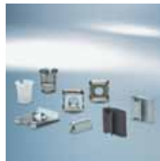
› Hitri vezni elementi in sponke | Quick fastening elements and clips