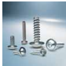
› Industrijska vijačna tehnologija Screw technology