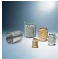
› Navojni vložki Thread inserts