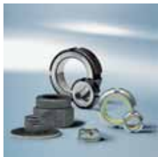
› Varovalne matice Lock nuts