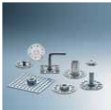
› Vezni elementi za kompozitne materiale Bonding fasteners