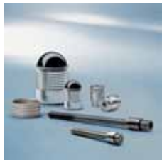
› KOENIG-EXPANDER® Čepi KOENIG-EXPANDER® Plugs