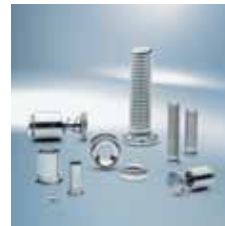
› Vtisni vezni elementi Self-clinching fasteners