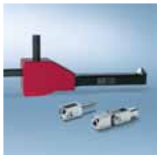
› Posebni procesi Special processes