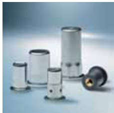
› Vgradne-kovične matice Blind rivet nuts