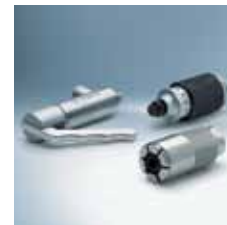
› Hitre spojke in adapterji 1) Quick connectors 1)

1) Ni na razpolago v Sloveniji. | Not available in Slovenia.