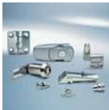
› Zapirala Access solutions