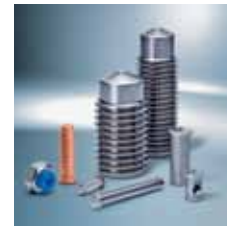
› Vezni elementi za varjenje Stud welding systems