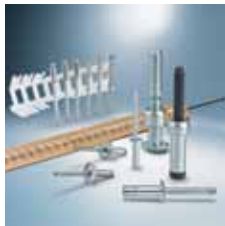
› Tehnologija slepega kovičenja | Blind rivet technology