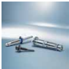
› Vezni elementi za gradbeništvo 1) Construction fasteners 1)