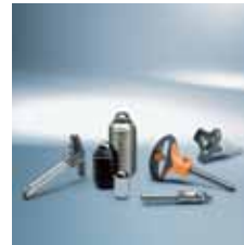
› Elementi za aretiranje in vzmetni vijaki | Quick release pins and spring plungers